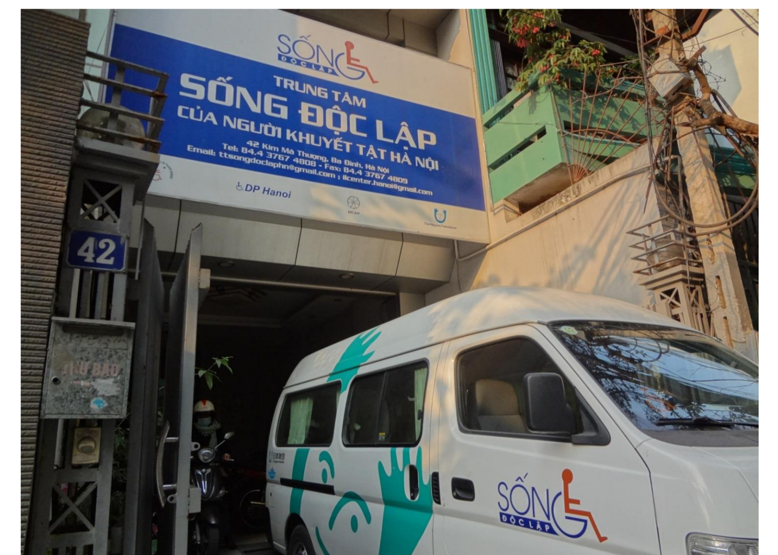
写真右 ハノイILセンター事務所

「障害者法」制定に向けて(2011年制定) ・VNAH(Viet-Nam Assistance for the Handicapped)ベトナム障害者協会。NGOの団体で障害者法制定の草案作成に参加