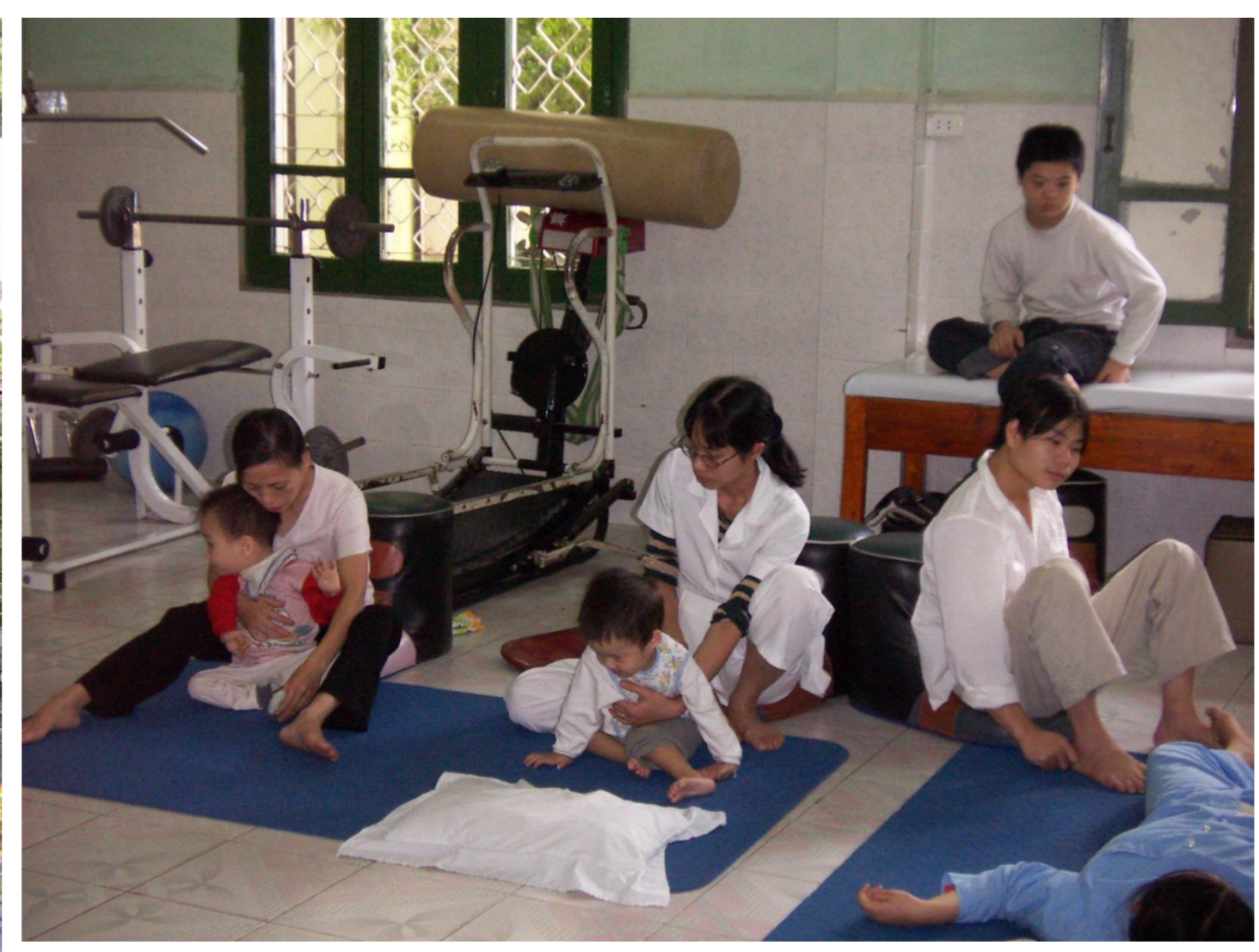
写真上段: 2005年ベトナム平和・友好村