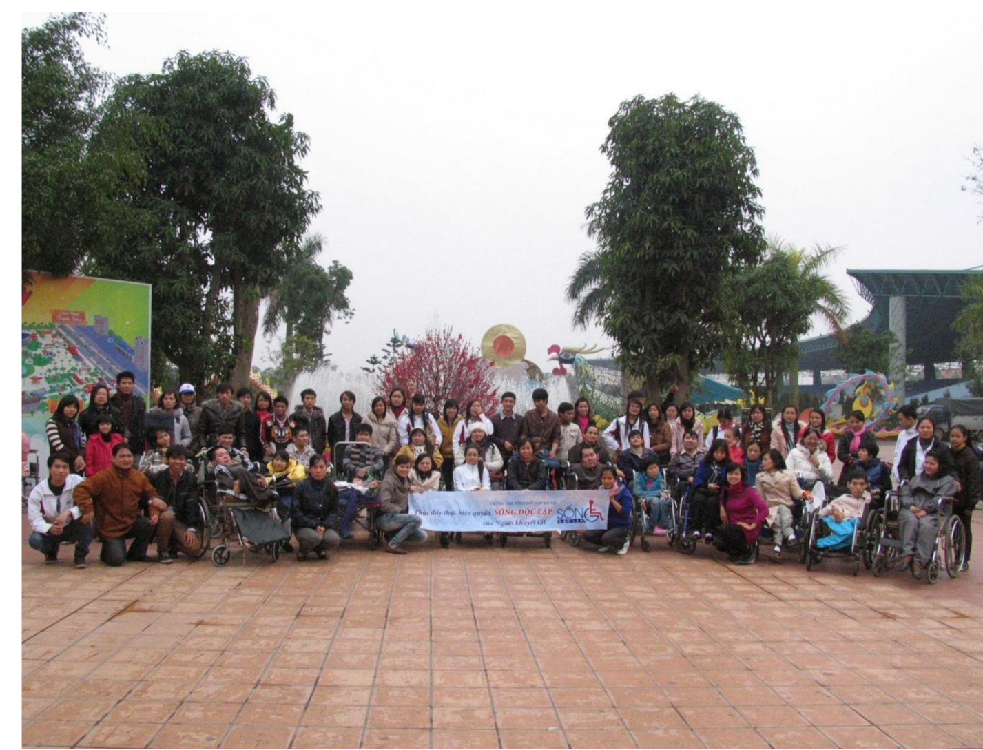
写真左 ハノイILセンター日帰り旅行

・ハノイILセンター ピア・カウンセリング、自立生活プログラム、介助サービス、自立生活予算に関する政府への要望提出など