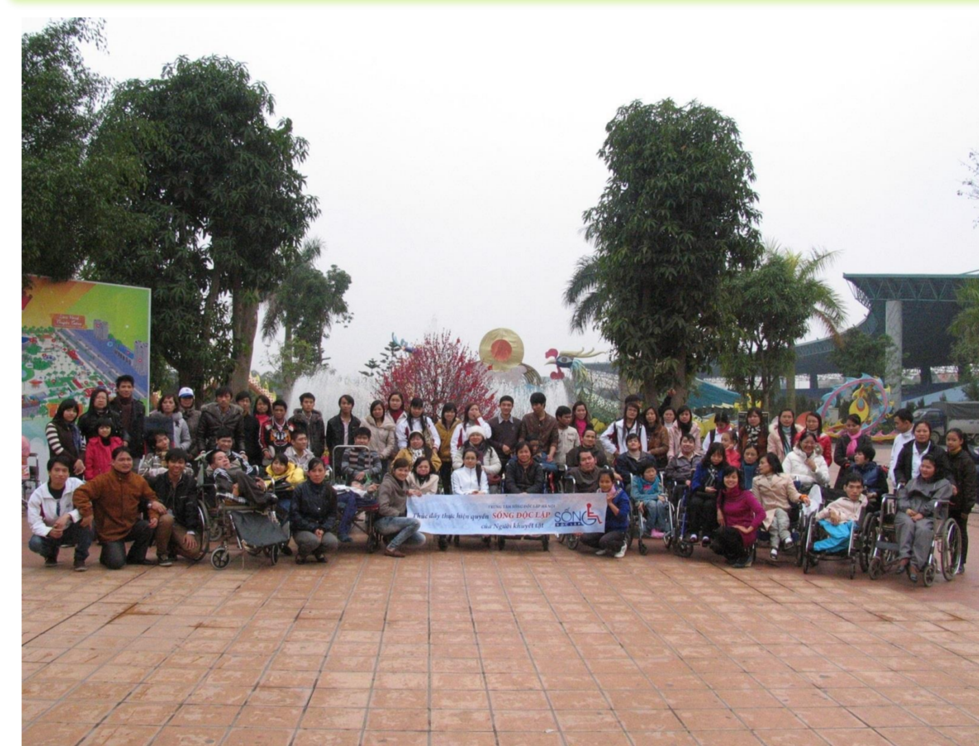
사진(왼쪽) 하노이IL센터 1일 여행