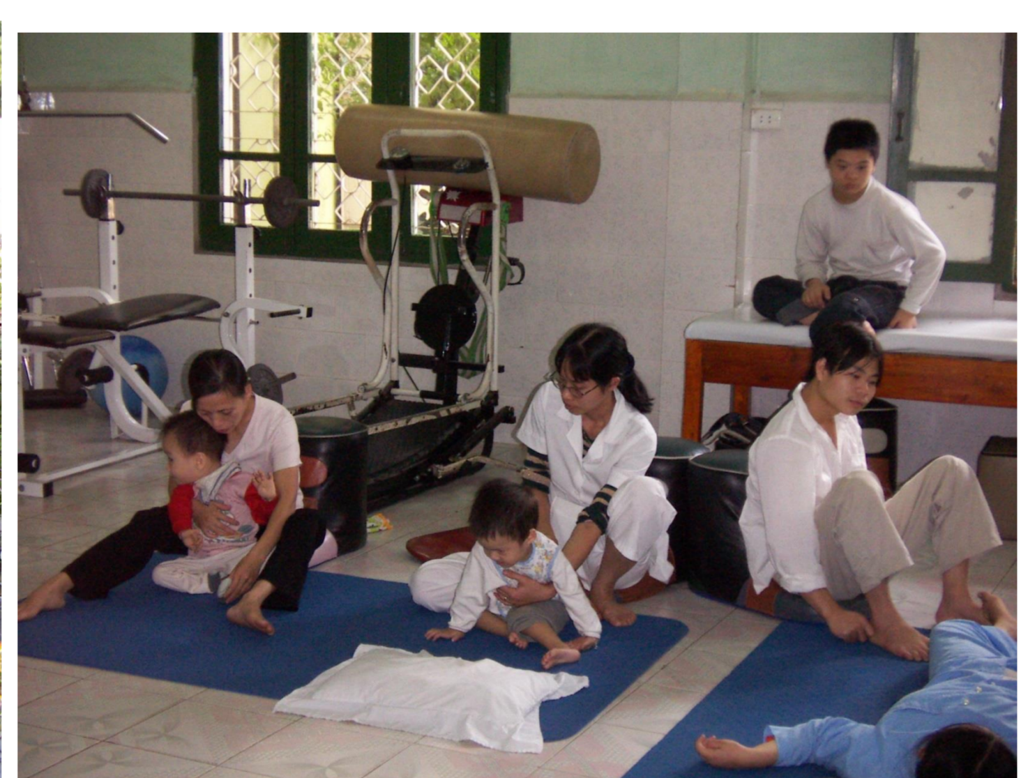
사진(위): 2005년 베트남 평화·우호마을