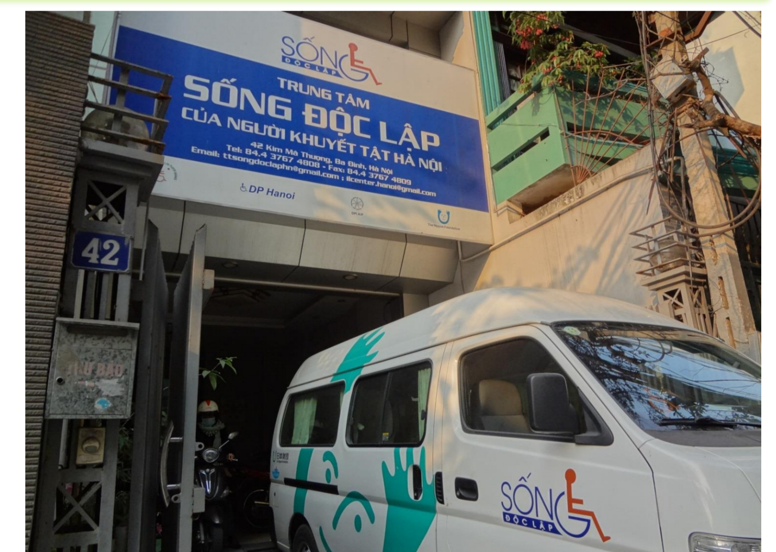
사진(오른쪽) 하노이 IL 센터 사무소