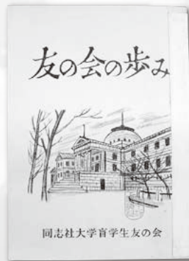
同志社大学盲学生友の会編 「友の会の歩み」 1964年 同志社大学同志社史料資料センター所蔵