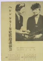
パンフレット 「ヘレンケラー女史 歓迎講演会」