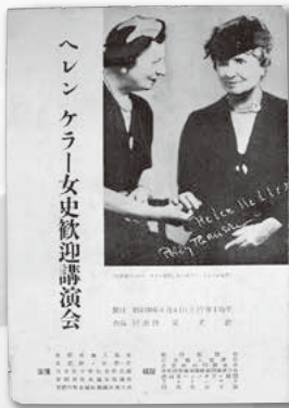
パンフレット 「ヘレン ケラー 女史歓迎講演会」 1955年 同志社女子大学史料センター所蔵

同志社大学の障がい学生支援制度は2020年(令和2)で制度発足20年を迎えました。本展では障がい学生支援制度20年の歴史とその前史を振り返り、今後の障がい学生支援制度の在り方を考えます。