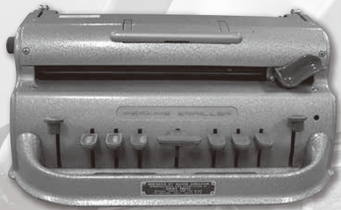
点字用タイプライター「Perkins Brailier」 昭和時代 同志社大学学生支援機構学生支援センター障がい学生支援室所蔵