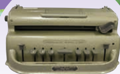
点字用タイプライター 「Perkins Braille」

ハリス理化学館 同志社ギャラリー 2階 企画展示室 (同志社大学今出川キャンパス)