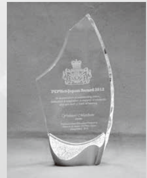
記念盾 「PEPNet-Japan Award2012」 同志社大学学生支援機構学生支援センター 障がい学生支援室所蔵