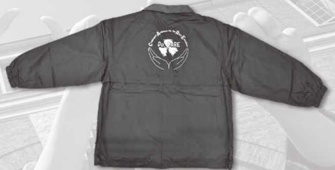
DO, CAREロゴ入りスタッフジャンパー 平成時代 同志社大学学生支援機構学生支援センター障がい学生支援室所蔵